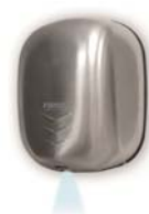
STREAM DRY UV SF