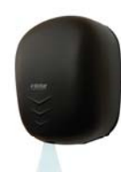
STREAM DRY UV NF