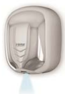
STREAM DRY UV LF