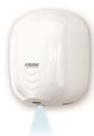
STREAM DRY UV ABS STREAM DRY UV BF