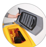
Debris tray + filtro