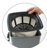
Filtro poliestere (versione FT)