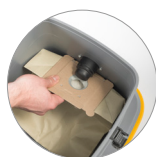
Sacchetto in carta ecologica