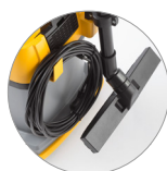
Nuovo sostegno accessori e cavo