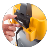
Sistema di filtraggio aria di scarico