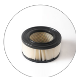
Filtro a cartuccia (versione FC)