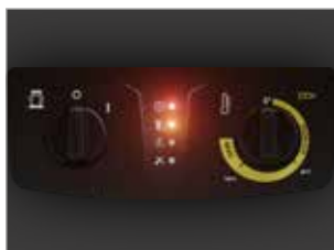
PANNELLO DI CONTROLLO CON SPIE DI SEGNALAZIONE