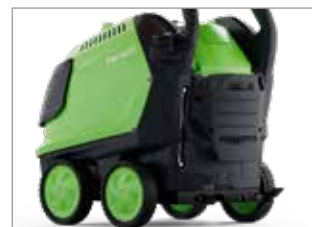
SERBATOIO RESISTENTE E GRANDE E PORTA ACCESSORI