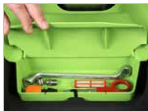
FACILE ACCESSO PER LA MANUTENZIONE