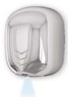
STREAM DRY UV LF