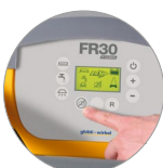
Funzione modalità silenziosa