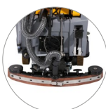
Tergitore regolabile e compatto