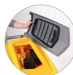
Debris tray + filtro